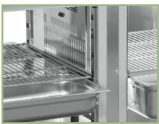
Large evaporators behind door mullions