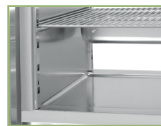
Rounded corners and pressed bottom