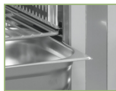
E-shaped sliders to stack GN shelves and pans