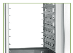
Bakery racking (option)

The B1 Gastroflex pass-through counter is a true all-rounder. Fitted with extra-wide doors on both sides to provide easy access to the huge compartments, the B1 was designed to perform as an island suite in professional kitchens.