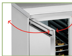
Self-closing doors with automatic hold-open at 100°